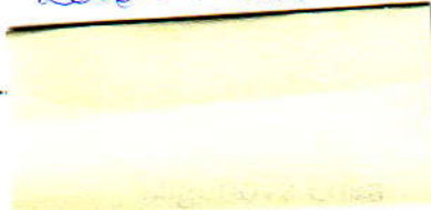
államháztartási pénzügyi és számíteli osztályvezető BETHLEN GÁBOR ALAPKEZELŐ ZRT.